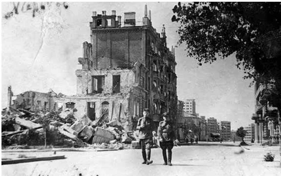
Вул. Іванова, м. Харків, 23 серпня 1943 р.

Успішне здійснення колосального проекту з подолання жахливих наслідків війни вимагало від Головного архітектора Харкова О. М. Касьянова справді державницьких підходів до розв’язання гострих проблем. Серед них – необхідність узгодження галузевих інтересів значної кількості промислових підприємств, які вели розбудову виробничих та господарських корпусів і житла для своїх працівників із перспективою розвитку міста.