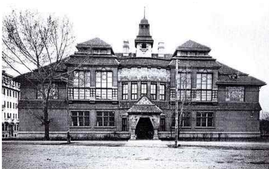
Харківський художній інститут

Під час навчання в господарському інституті у 17-річного хлопця проявилось неабияке художнє обдарування. Не маючи жодної фахової підготовки, юнак у 1923 р. починає працювати художником у Харківській Секції образотворчих мистецтв Спілки працівників мистецтв (ИЗО РАБИС). Тож 15 вересня 1924 р. він стає студентом архітектурного відділу Харківського художнього технікуму (невдовзі технікум було реорганізовано в інститут) [18, спр. 151, арк. 3].