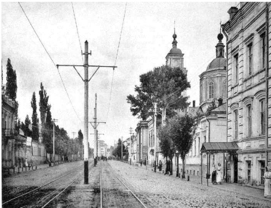
Курськ, початок ХХ ст.