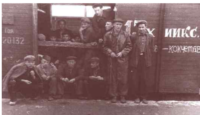
Перший студентський будівельний загін інституту, 1956 р.

Саме у цей період (у 1956 р.) розпочинає свою історію рух студентських будівельних загонів ХІКБ.